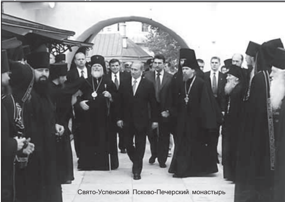
Свято-Успенский Псково-Печерский монастырь