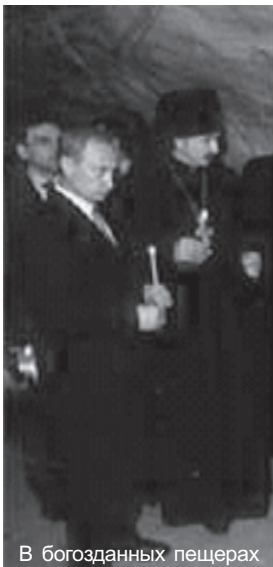
В богозданных пещерах